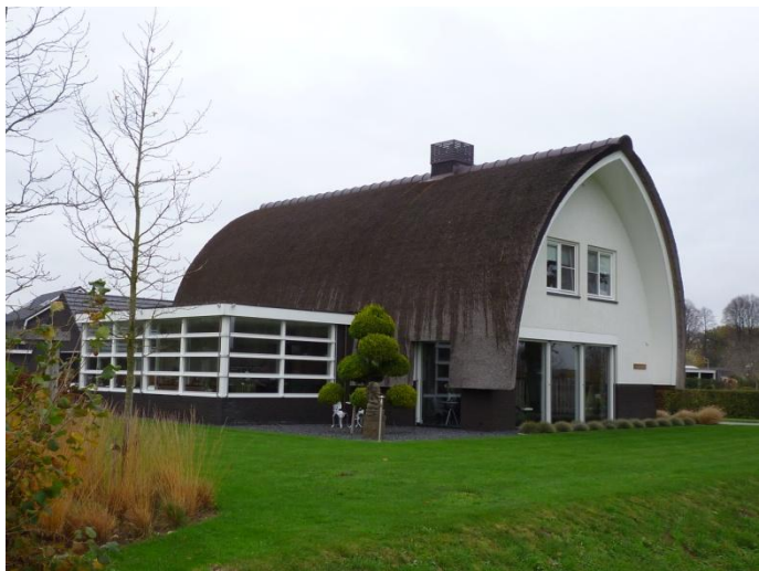
Nog vlak bij het startpunt een bijzonder huis.