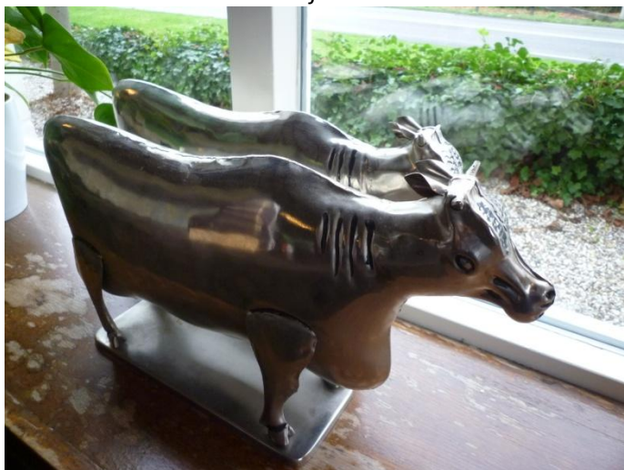
Ook door de alom aanwezige koeien; een steekt er zijn nek uit om nog beter .....