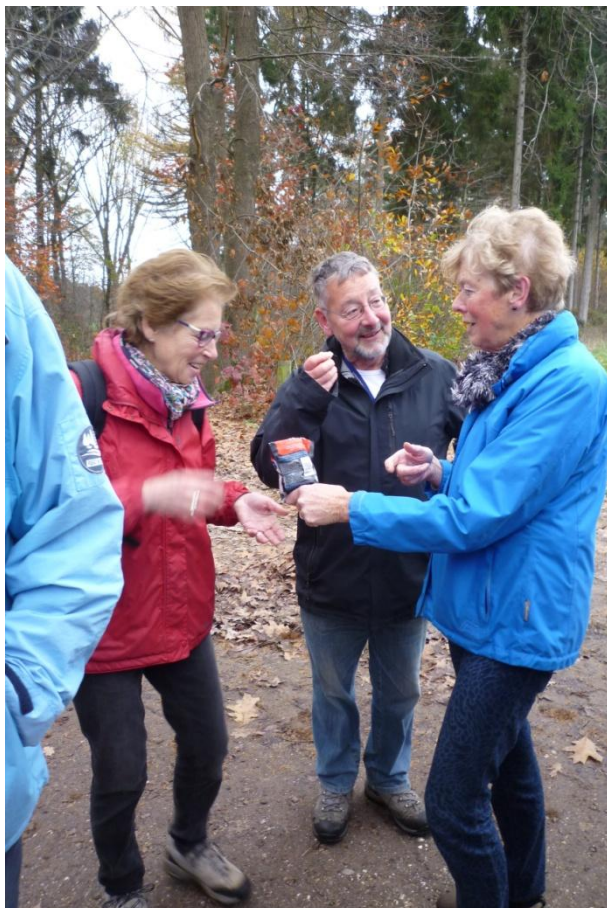
Het ritueel van de schoolkrijtjes..... altijd welkom!