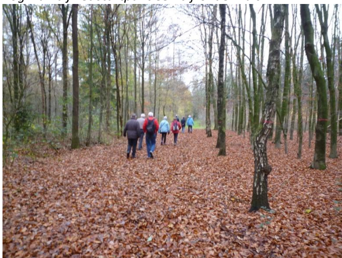
Mooie kleuren in het bos