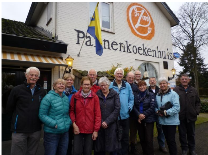
Een vriendelijke serveerster bood aan een groepsfoto te maken. We hebben er duidelijk zin in.