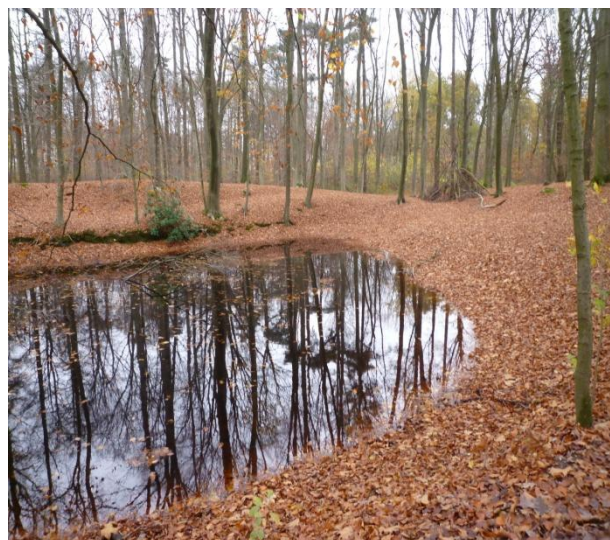
Het mooie boslandschap