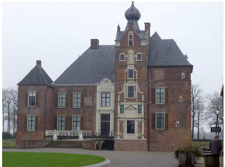
Maarten van Rossum bouwde het in de 16de eeuw.