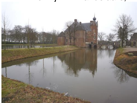
het kasteelpark heeft mooie vijvers