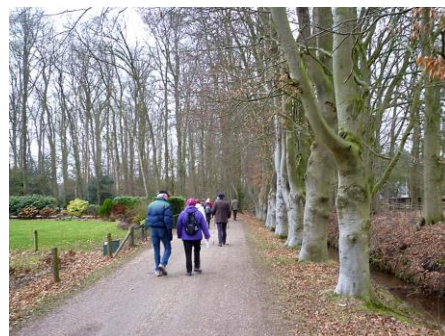
onderweg in het kroondomein