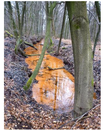
Sommige beken zijn sterk ijzerhoudend