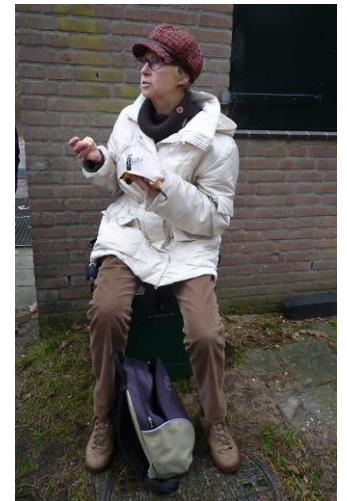
Dit is heel lekker