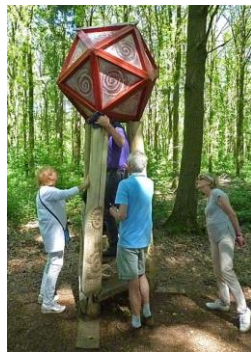
inside a tree