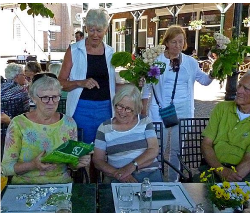
Bloemen voor de organisatoren