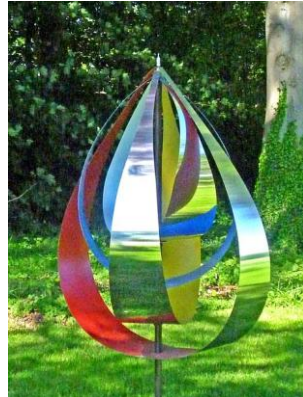
waterdrop shaped tree