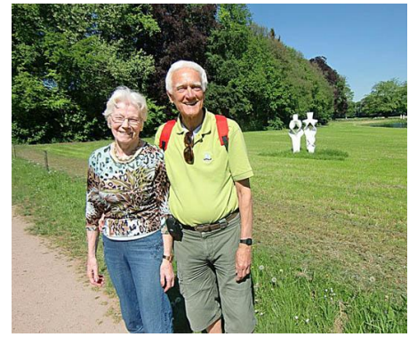
zie de mens (op de achtergrond)