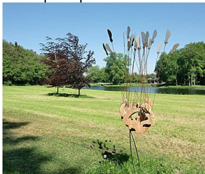
ode aan de esdoorn