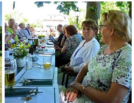
in afwachting van de kunstlunch