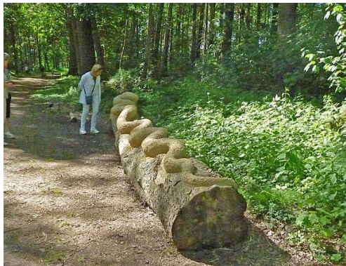
slang op stam