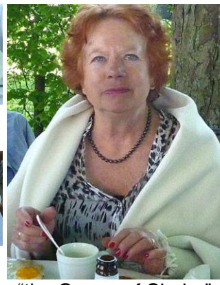
"the Queen of Sheba"