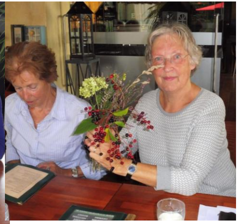
De organiseerders worden traditioneel bedankt met de oogst van onderweg.