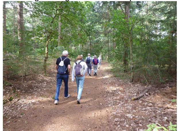
We staan stil bij 't Zand, bekend uit het lied van Normaal: "Oerend Hard"