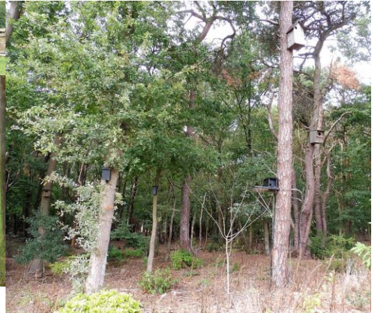
we tellen er negen (vogelhuisjes)