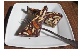
met koffie en Arretjescake