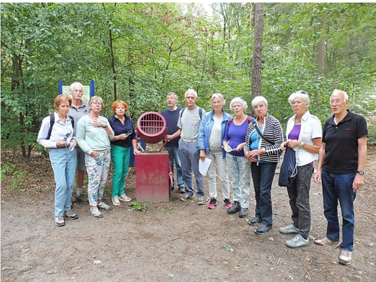
Gegroepeerd rond het Zoeklicht