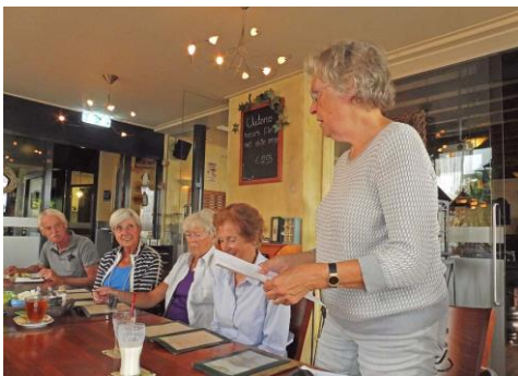
Een nieuwe traditie in de wandeling; cultuur tijdens de lunch.