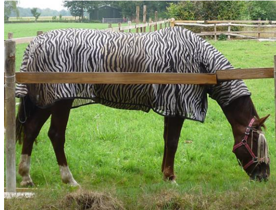
verrassend: een zebra paard!