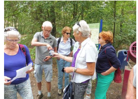
Traditioneel: de Juf deelt schoolkrijtjes uit