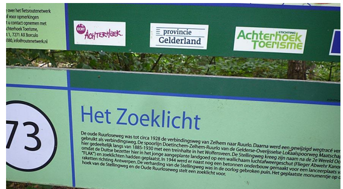
Ter herinnering aan het zoeklicht dat de Duitse bezetter hier plaatste in WO II