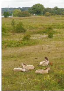
het domein van de koniksparden