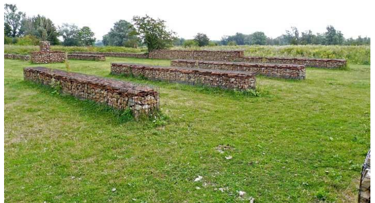
daar stond ooit een Castellum