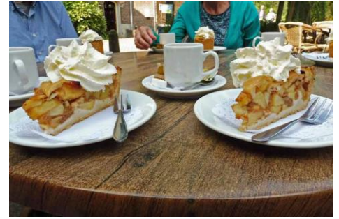
koffie met appeltaart