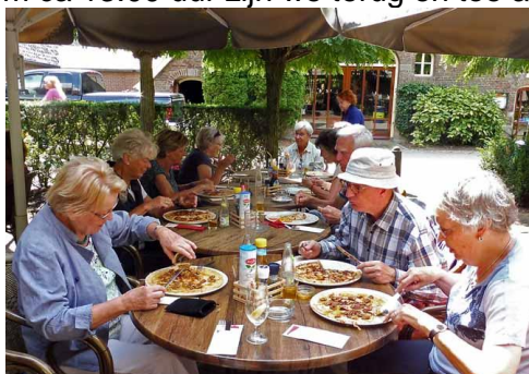
veel koeken met honing en.... ....pecannoten

Om ca 13.00 uur zijn we terug en toe aan een pannenkoekenlunch.