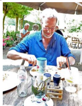
ook hij voelt zich thuis