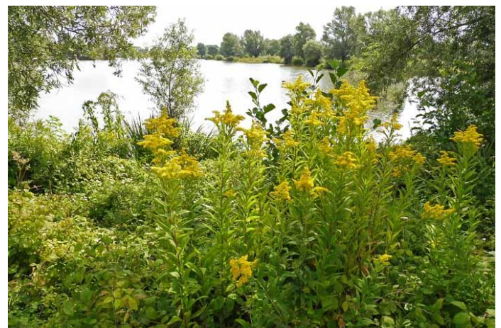
en ook gulden roede

heel veel springbalsemien in Meinerswijk stonden steenfabrieken, die klei hebben uitgegraven. Daarvan zijn grote plassen overgebleven met daarin tegenwoordig diverse watervogels. Arnhem is steeds dichtbij, zoals de doorkijkjes laten zien.