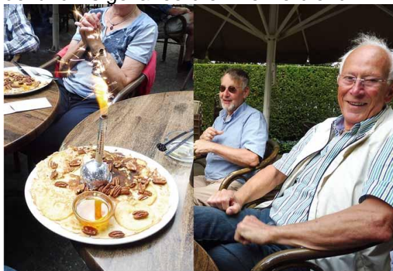
er is er een jarig vandaag; dat kun je wel zien!