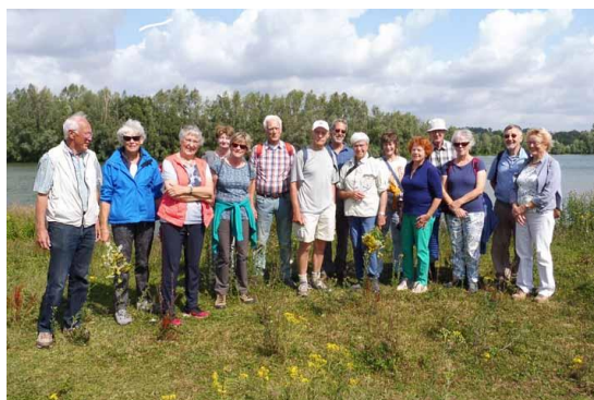
de 15 vrolijke wandelaars