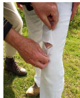
van wie is deze moderne broek?