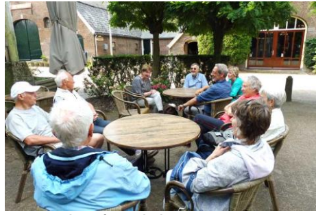
in afwachting van.....