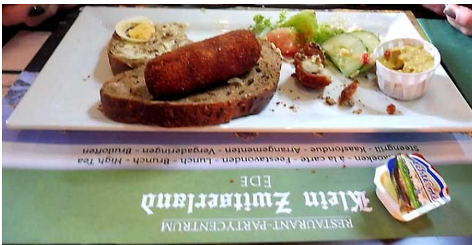
om ca 13.00 uur zijn we terug bij Klein Zwitserland ook hier goeie kroketten!