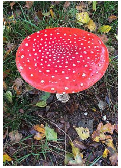
Paddestoelen in soorten en maten, ook die van kabouter Spillebeen....."rood met witte stippen."