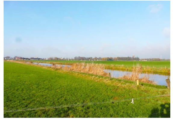
het is een prachtige herfstdag