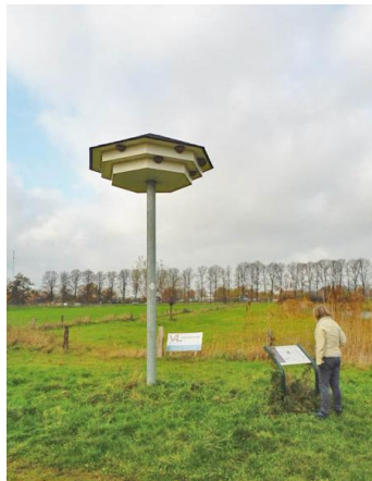
huiswaluw B & B

Broed- en nestgewoontes Huiswaluwen maken een nest van vele honderden klompjes modder. De nestplaats bevindt zich tegen buitenmuren, direct onder een overstekende dakrand of onder bruggen. De vogels hebben een zeer sterke voorkeur voor een witte achtergrond, daarom is de huiswaluwtil ook wit geverfd.