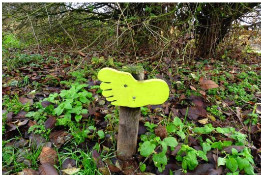
voor elk wat wils: wandelende P-leden

Broed- en nestgewoontes Huiswaluwen maken een nest van vele honderden klompjes modder. De nestplaats bevindt zich tegen buitenmuren, direct onder een overstekende dakrand of onder bruggen. De vogels hebben een zeer sterke voorkeur voor een witte achtergrond, daarom is de huiswaluwtil ook wit geverfd.