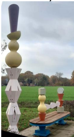
kunst om bij te zitten