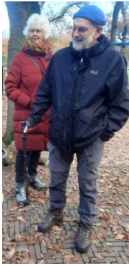
zij voelen zich hier thuis

De 64 ste wandeling speelt zich af in de streek van de Salemink voormoeders. Er zijn 9 wandelaars die met koffie beginnen in restaurant Engbergen bij Gendringen. Na een historisch inkijkje in de streek starten we om half twaalf met de wandeling.