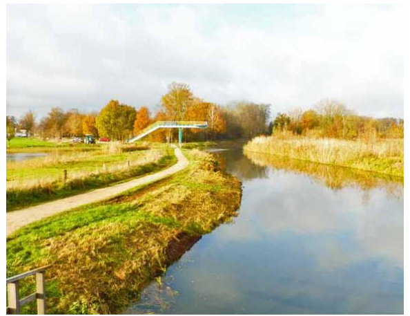
de Oude IJssel met uitzichtpunt