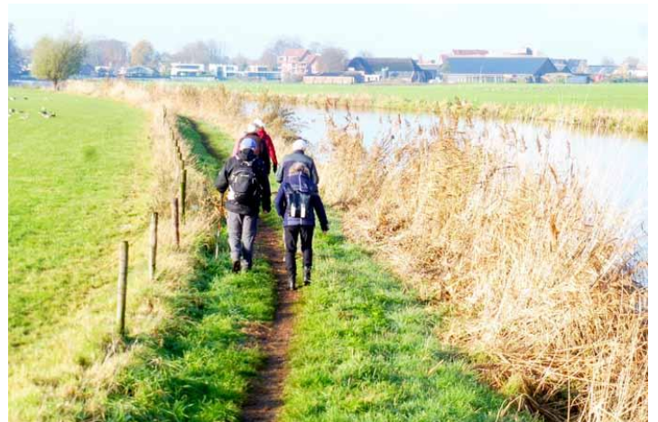
Ganzen en wandelaars langs de Bocholter Aa