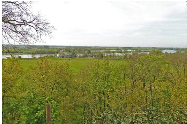
al snel het prachtige panorama over het Rijndal.