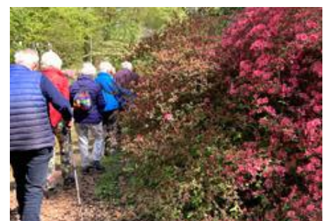
het "laantje van Maria"