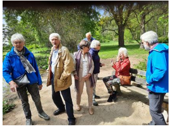
stof tot discussie