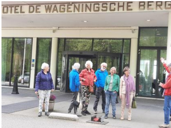
Na de koffie op weg

De 66 ste wandeling speelt zich af in en om Arboretum Belmonte in Wageningen. Om 10:30 verzamelen, in Hotel de Wageningse Berg, 10 wandelaars voor de startkoffie. Te midden van een grote schare Engelse veteranen die al snel door een optocht van Engelse taxi's worden meegenomen.