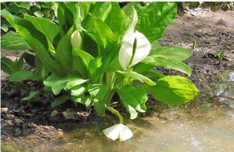
Behalve rhododendrons ook Aronskelk