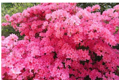
de mooiste kleuren