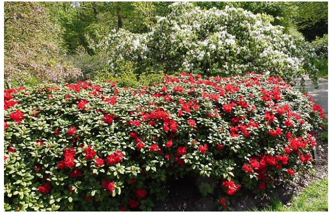
In het Arboretum bloeien de rhododendrons volop