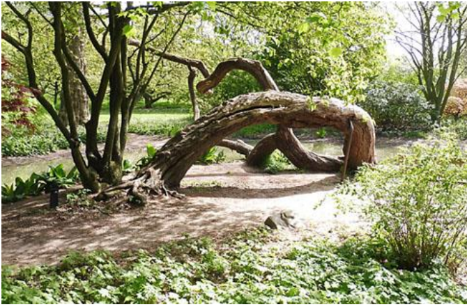
een dode boomstam