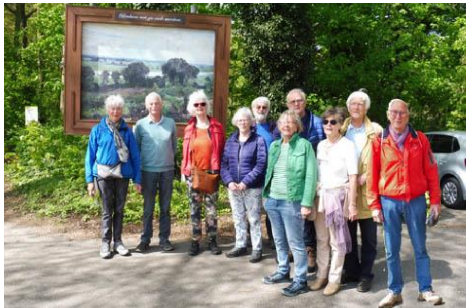
De 10 tevreden wandelaars

Ook hier een heerlijk 12-uurtje waarin een kroket met zonder mosterd